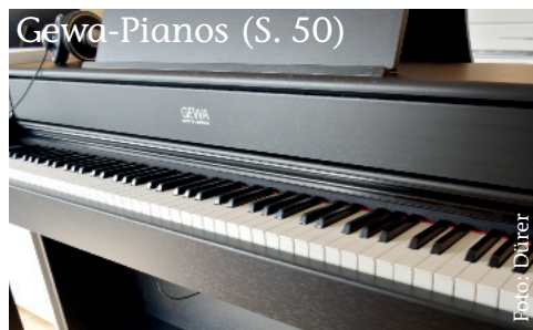
Gewa-Pianos (S. 50)