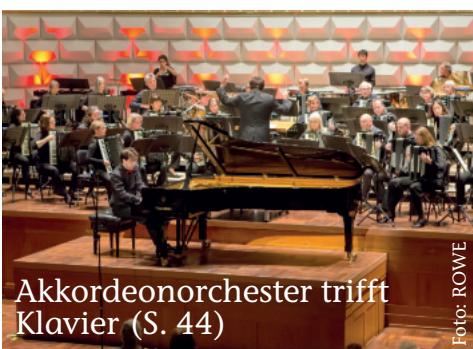
Akkordeonorchester trifft Klavier (S. 44)