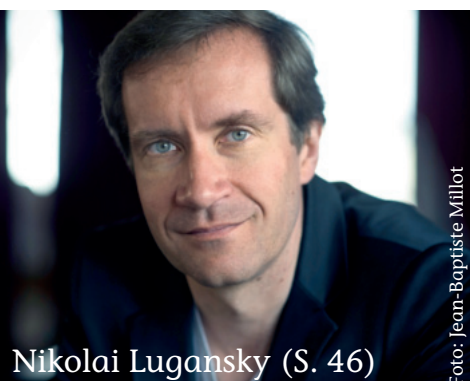
Nikolai Lugansky (S. 46)