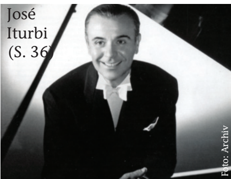
José Iturbi (S. 36)