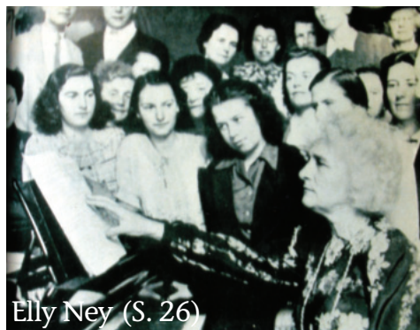
Elly Ney (S. 26)