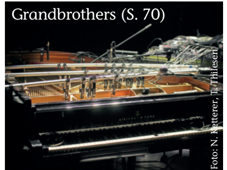
Grandbrothers (S. 70)