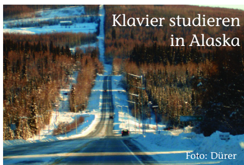
Klavier studieren in Alaska