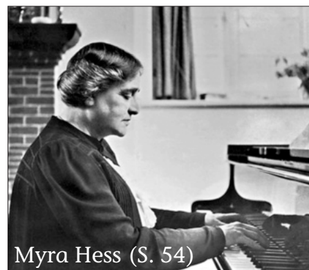
Myra Hess (S. 54)