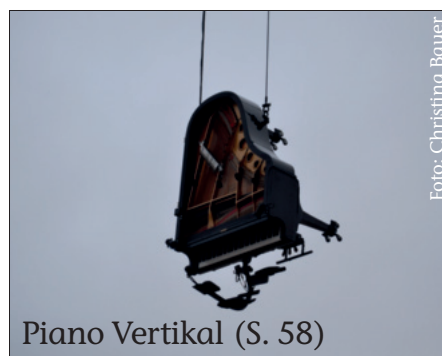
Piano Vertikal (S. 58)