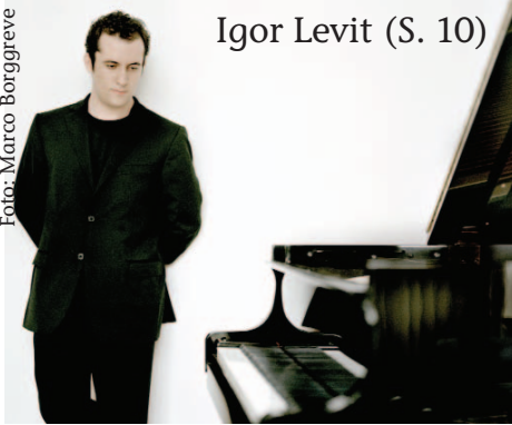
Igor Levit (S. 10)