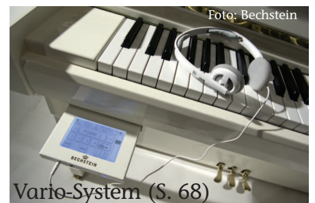
Vario-System (S. 68)