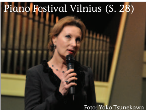
Piano Festival Vilnius (S. 28)