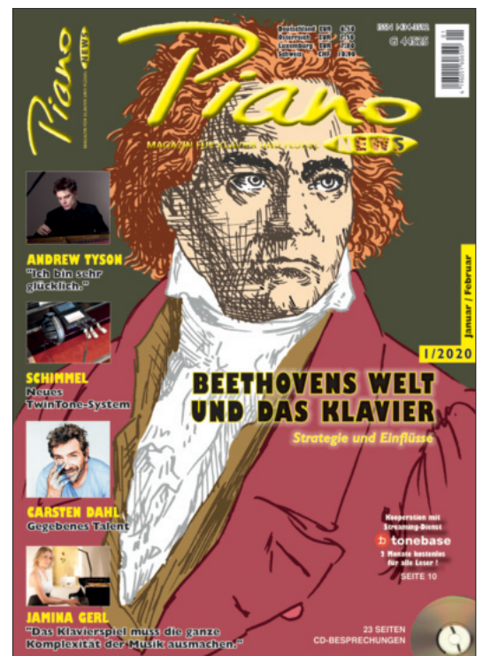
Titellustration: Wolfgang Hülk