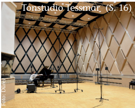
Tonstudio Tessmar (S. 16)