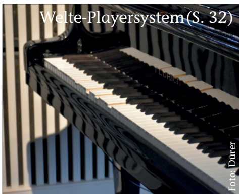
Welte-Playersystem (S. 32)