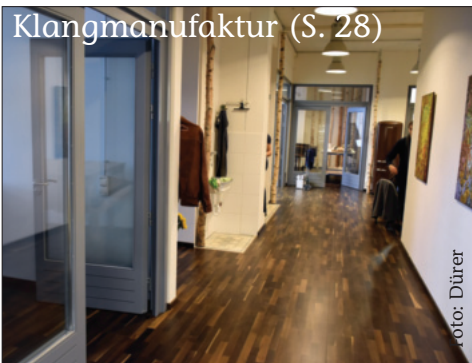
Klangmanufaktur (S. 28)