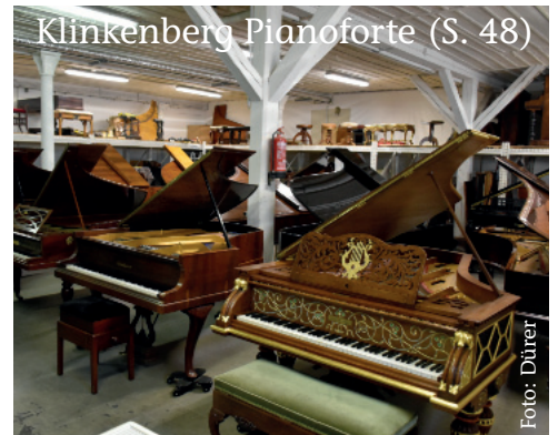
Klinkenberg Pianoforte (S. 48)