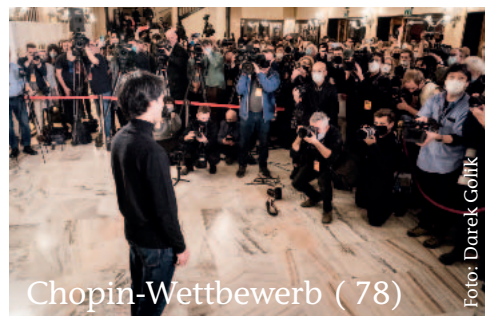
Chopin-Wettbewerb ( 78)