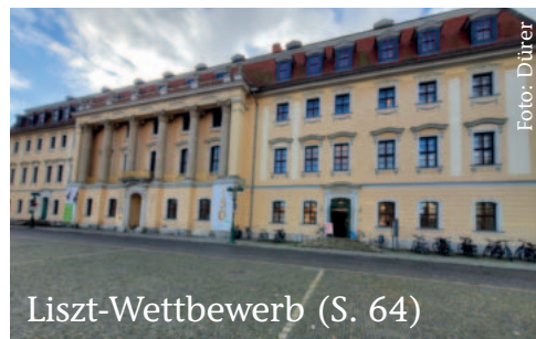
Liszt-Wettbewerb (S. 64)

HÄNDLER DAS BESONDERE IM ÜBLICHEN NEUES BECHSTEIN-CENTRUM IN NÜRNBERG