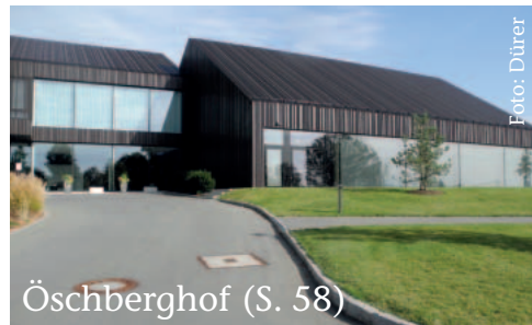
Öschberghof (S. 58)

WETTBEWERBE GENERATIONSWECHSEL BLICK AUF DEN 10. LISZT-WETTBEWERB WEIMAR-BAYREUTH