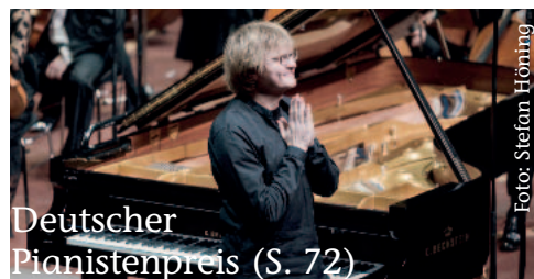
Deutscher Pianistenpreis (S. 72)