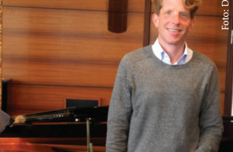
Schimmel (S. 54)