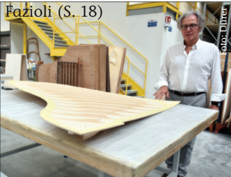
Fazioli (S. 18)