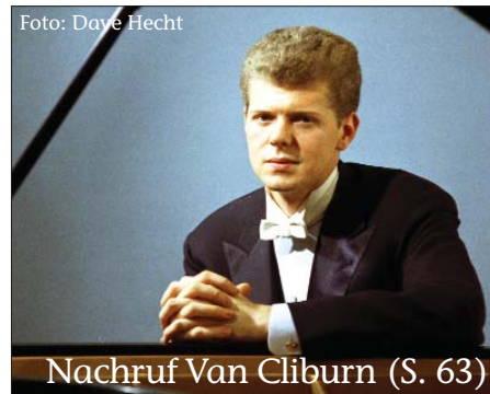
Nachruf Van Cliburn (S. 63)