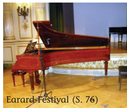
Érard-Festival (S. 76)