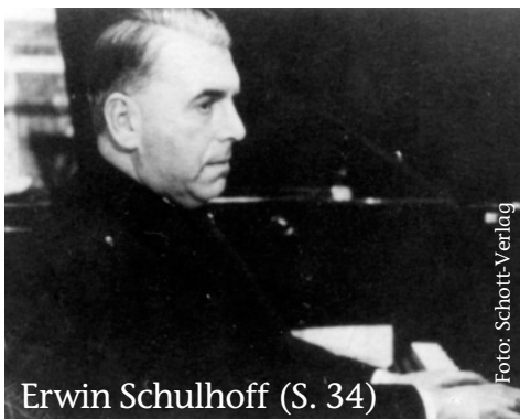
Erwin Schulhoff (S. 34)