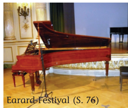
Érard-Festival (S. 76)